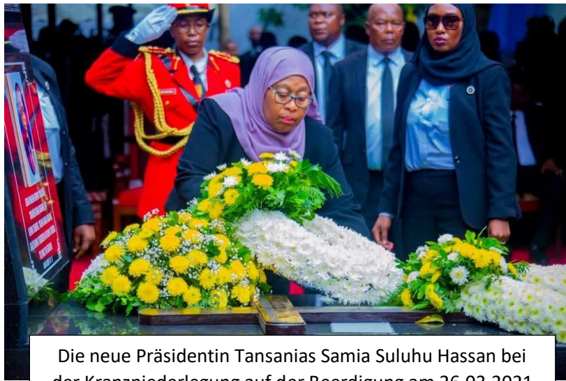
Die neue Präsidentin Tansanias Samia Suluhu Hassan bei der Kranzniederlegung auf der Beerdigung am 26.03.2021

In Tansania war er als Präsident sehr beliebt, die ausländische Presse stand seiner Politik kritisch gegenüber. Die Vizepräsidentin Samia Suluhu Hassan wurde nun als neue Präsidentin des Landes vereidigt. Bisher ist der Wechsel reibungslos und friedlich verlaufen. Wer mehr über die politischen Ereignisse in Tansania lesen möchte, sei auf folgende Zeitungsartikel verwiesen: